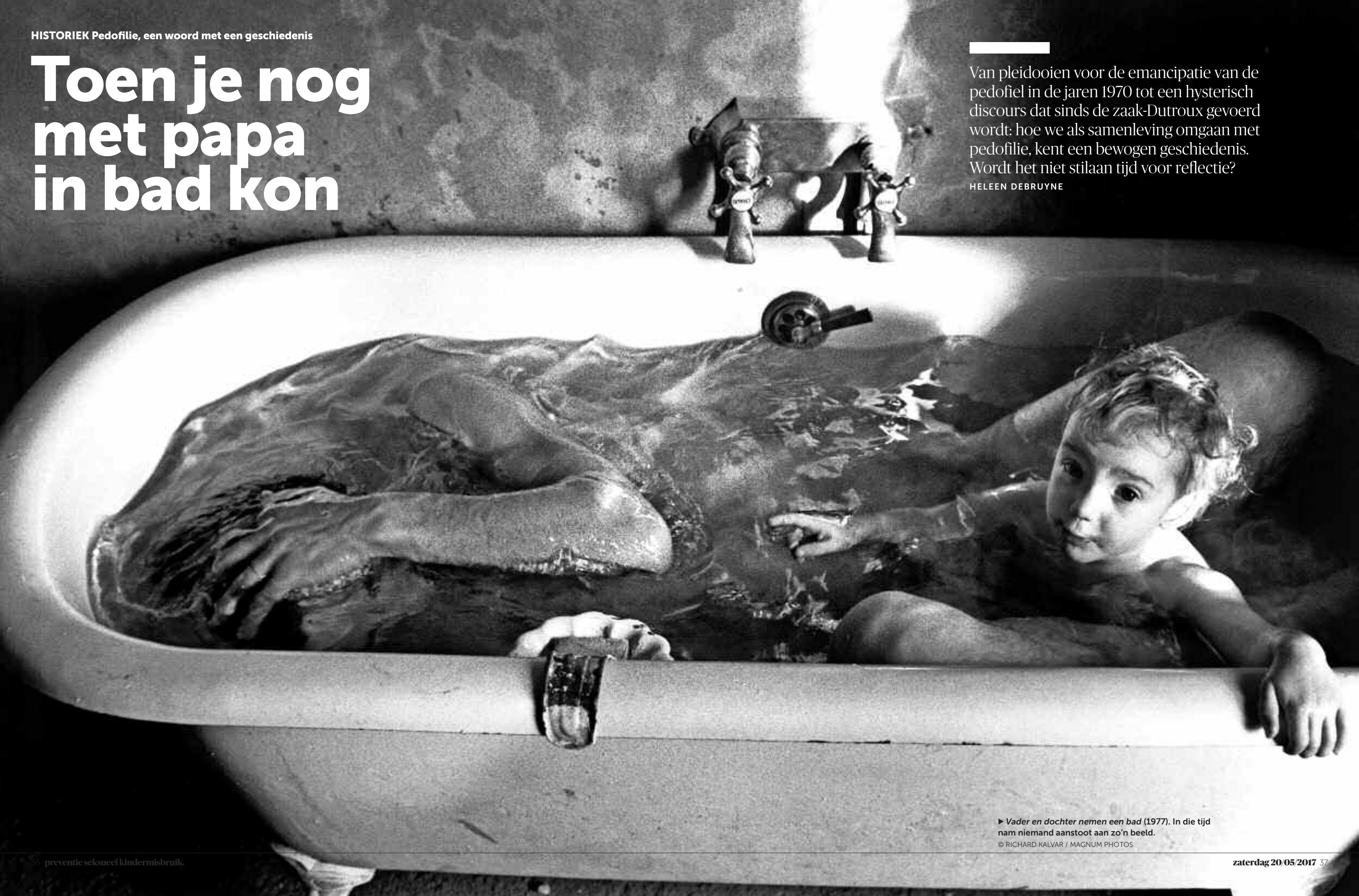
► Vader en dochter nemen een bad (1977). In die tijd nam niemand aanstoot aan zo'n beeld.